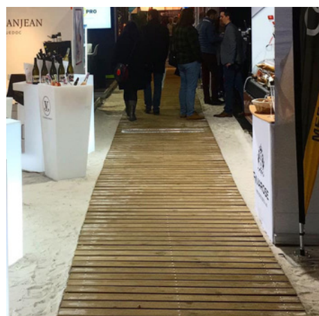
SIPRHO - Salon des Plages, La grande Motte, France.