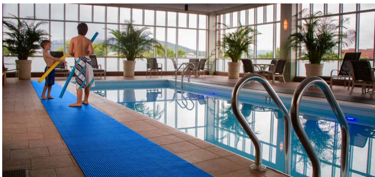
Wetfloor installé dans la piscine intérieure d'un hôtel en Alsace (France)