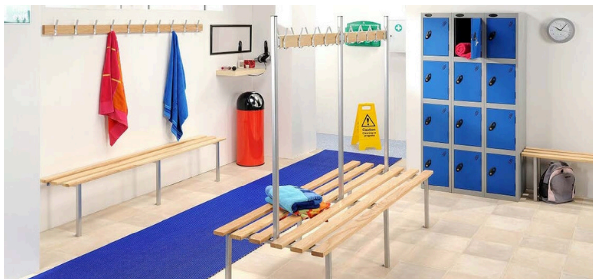
Wetfloor installé dans un vestiaire à St Nicolas de Port (France)